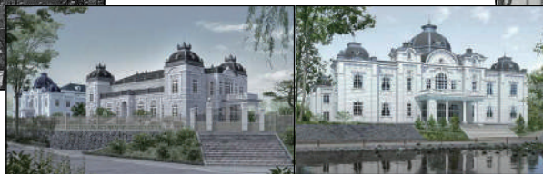
秋田県記念館 (1918年-1960年)