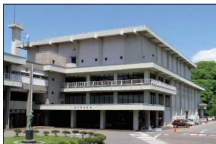
2代目県民会館 (1961年～2018年)